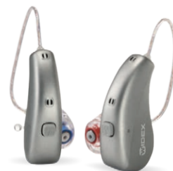
Das weltkleinste wiederaufladbare Lithium-Ionen-Hörsystem seiner Art